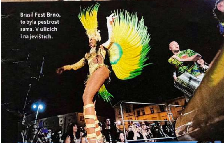
Brasil Fest Brno, to byla pestrost sama. V ulicích i na jevištích.